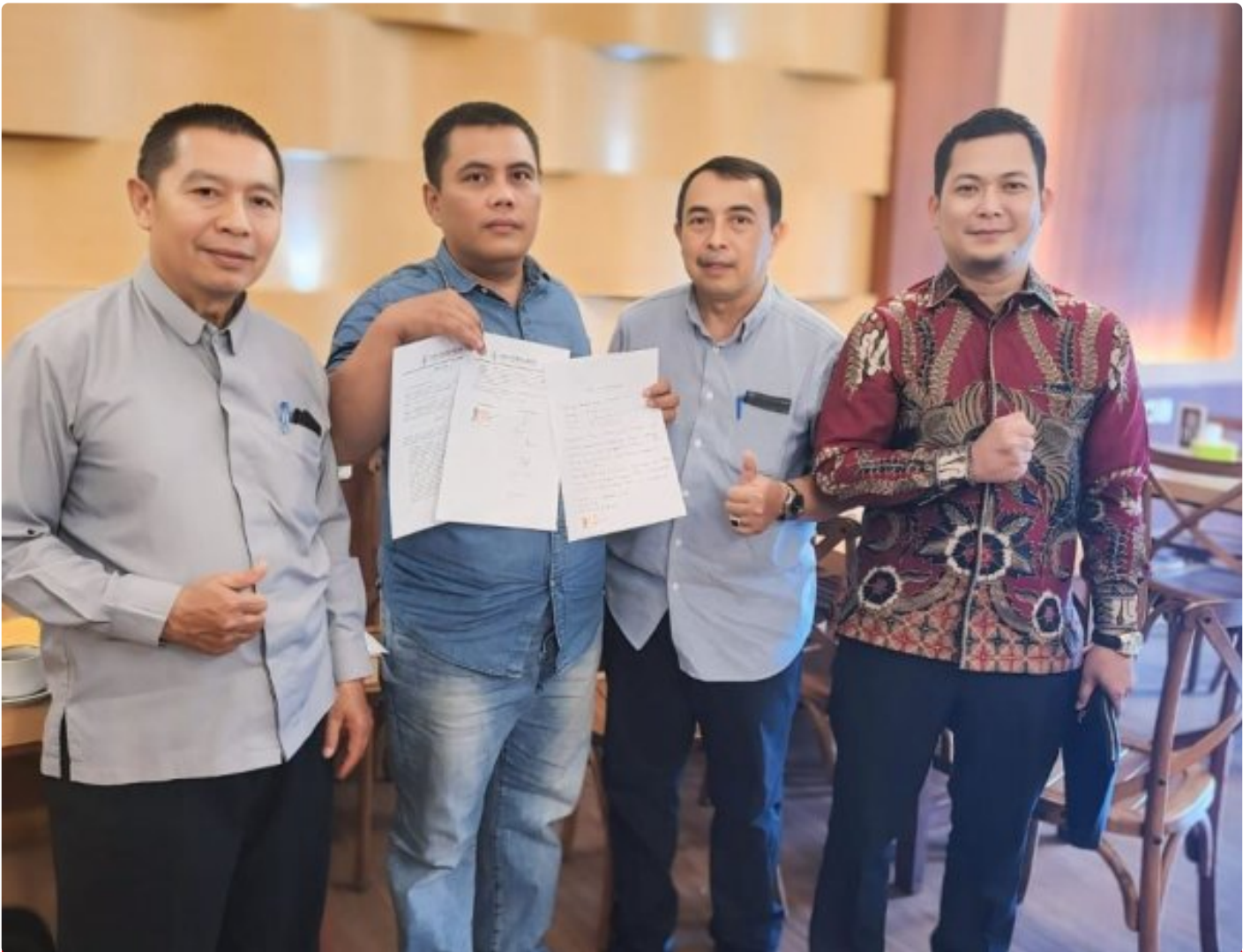
Kuasa Hukum Ningto Wahyu Dens & Partners Lawfirm di perkara Dugaan Pemalsuan Data dan Kredit Fiktif di Bank BRI Unit Kalideres.

JAKARTA, JNI - Seorang bekas nasabah Bank BRI, yang dikenal dengan inisial NW, melaporkan dugaan pemalsuan data dan kredit fiktif yang melibatkan oknum pegawai Bank BRI Unit Kalideres.